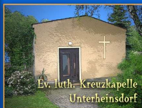
Ev. luth. Kreuzkapelle Unterheinsdorf