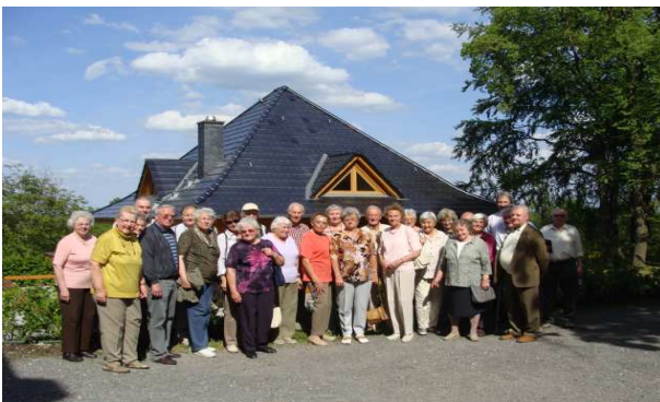
Neues Geistliches Zentrum und Backhaus