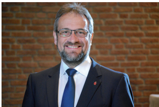
Bischof Harald Rückert Bischof der Evangelisch-methodistischen Kirche

http://www.emk.de/meldungen-2017/wir-sind-gemeinsam-kirche/