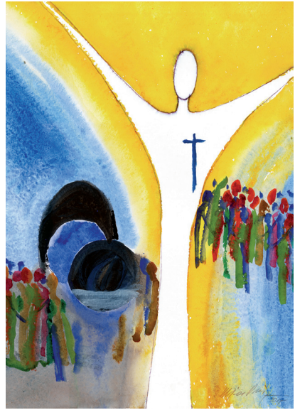
Aquarell von R. Piesbergen © Gemeindebriefdruckerei.de

Haben wir schon einmal darüber nachgedacht, welche Umwandlungen mit dem Ereignis des Ostertages verbunden sind? Wie mächtig waren doch die Feinde Jesu äußerlich durch die Kreuzigung geworden. Sie hatten der Welt gezeigt: Wir haben doch die Oberhand, es muss nach unserem Willen gehen. Ja, die Feinde Jesu waren mächtig. Aber wie ohnmächtig wurden sie am Ostermorgen! Das einzige Machtmittel, das sie noch gegen den Triumph der Auferstehung einzusetzen versuchten, war die Lüge, dass die Jünger den Leichnam Jesu des Nachts gestohlen hätten. Und die Jünger! Wie ohnmächtig waren sie vor Ostern! Die Ereignisse waren über sie hinweggegangen und hatten sie mutlos und enttäuscht gemacht. Aber nun kommt der Auferstandene zu ihnen, spricht sie an, nimmt ihnen die Angst und Zweifel und gibt ihnen Anteil an seiner Sendung durch den Vater. „Gleichwie mich der Vater gesandt hat, so sende ich